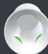
La géométrie interne de la coiffe permet le moulage du verrouillage rotationnel pour couronnes...