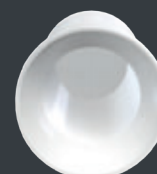
... et rotation pour les bridges